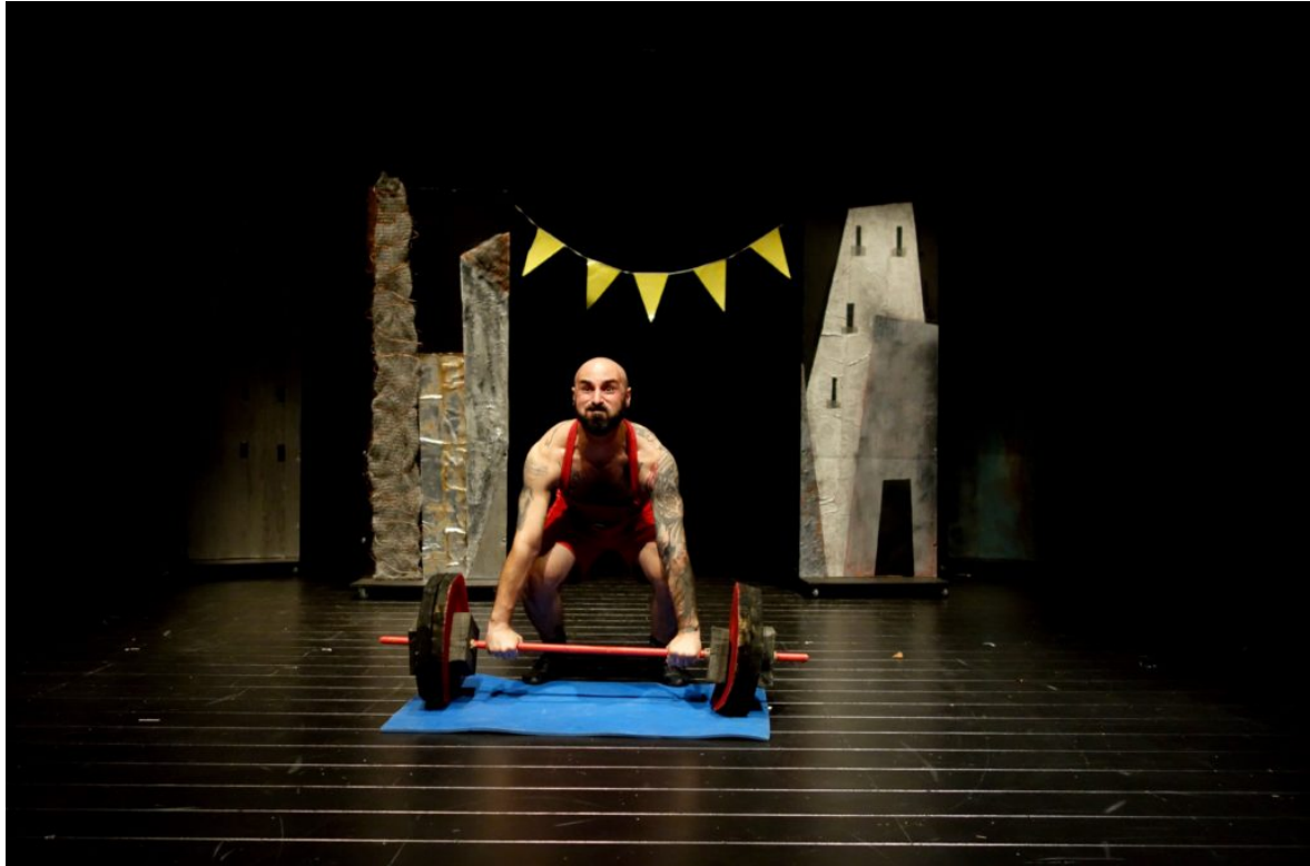
Ticina mani di corteccia

dare peso alla superficie, uno sguardo essenziale, capace di unire esistenze tanto diverse perché nella vita tutto è in movimento e non smette mai di scorrere.