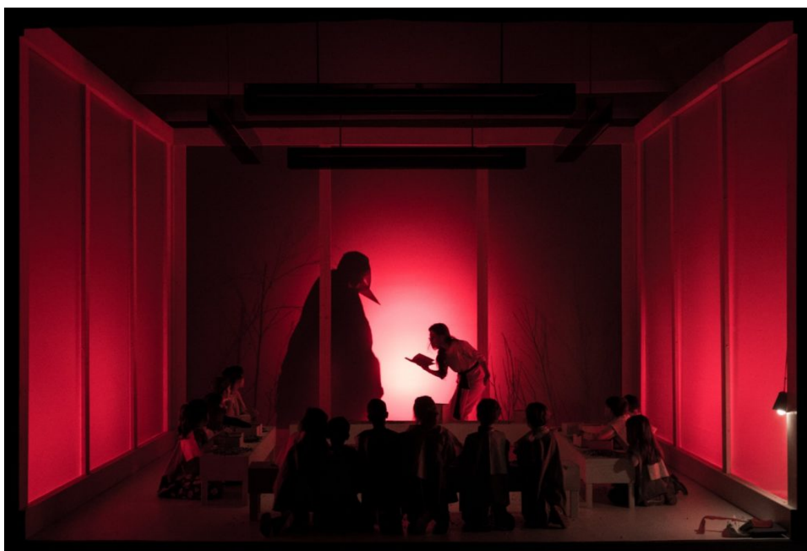
Fiabe Giapponesi di Chiara Guidi

politico. Perché se continua a essere per qualcuno di fragile, allora diventa meno interessante, non è un oggetto di analisi e di studio perché è più fragile politicamente, questa è la chiave. All'interno di quel panorama, si mantiene un corpo vivo ma invisibile e non alimentato. Se leggiamo oggi così la scuola, diventa un campo di battaglia necessario, formidabile, perché nella nostra società ormai da anni c'è un problema di dispersione scolastica, c'è un'ignoranza diffusa che non è più solo un problema educativo ma diventa addirittura motivo d'orgoglio. Come si pone il "teatro di senso" rispetto a questo?