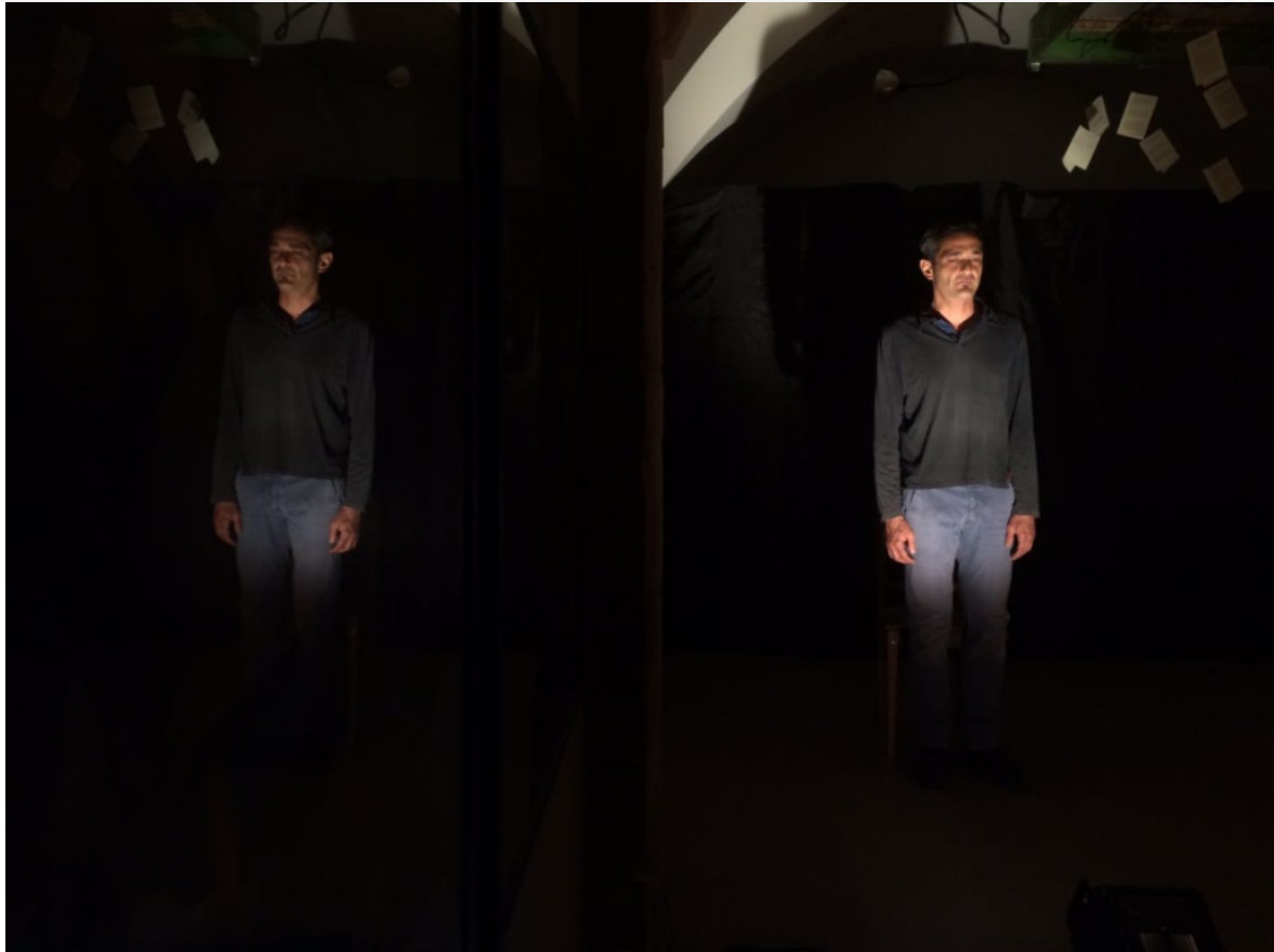
(Digiunando davanti al mare)

Lo spettacolo è nato da subito con un destinatario preciso?