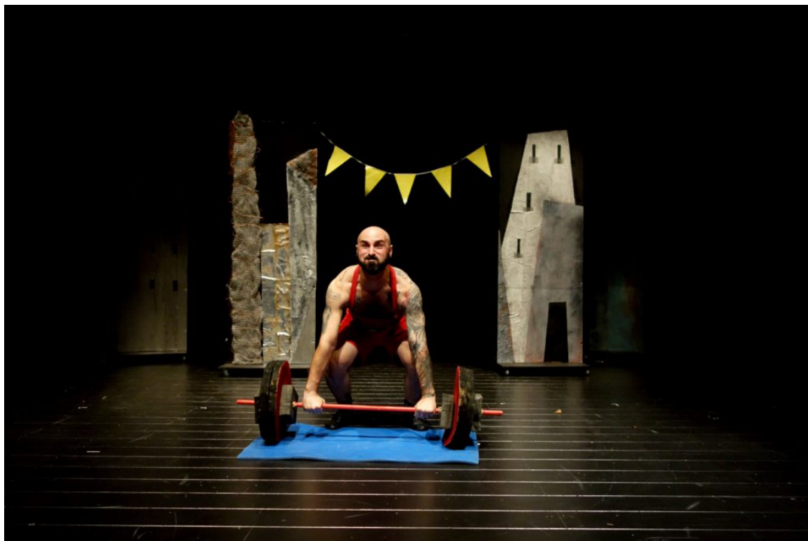
Ticina mani di corteccia

nella vita tutto è in movimento e non smette mai di scorrere.