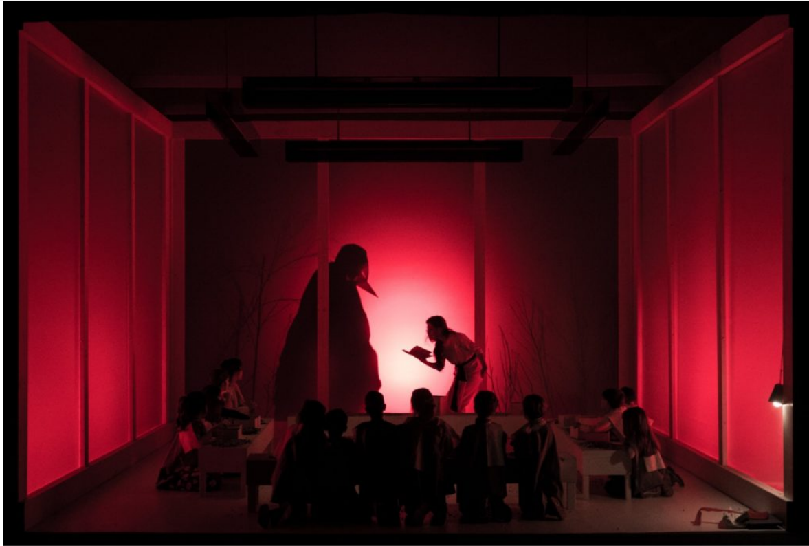
Fiabe Giapponesi di Chiara Guidi